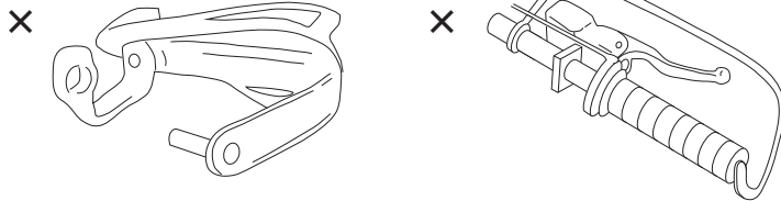
バーエンドに固定される形状（6-3-1） 金属製材質の支柱で囲われている形状（6-3-2）