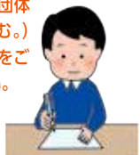
代表者がお手続き