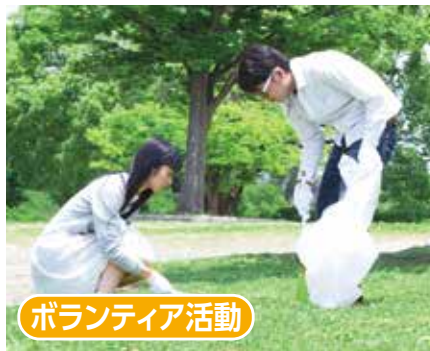
ボランティア活動