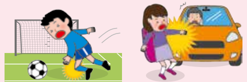
● 団体活動中のケガ ● 団体活動への往復中、車にはなられてケガをした場合

※AW区分にご加入の場合は、上記に加え、「団体での活動中およびその往復中」以外の事故も対象となります。ただし、熱中症、細菌性・ウイルス性食中毒を除きます。